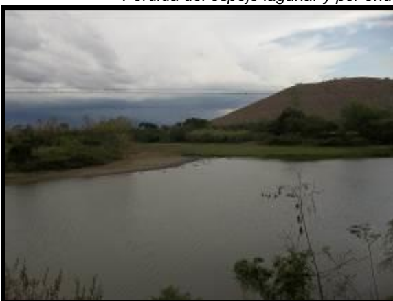
Buen estado del espejo lagunar