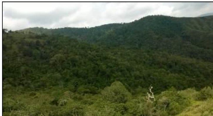
Cabecera de aislamiento finca Los Lagos. Se puede apreciar el ecosistema completo y la protección del mismo

-Respecto al contrato de prestación de servicios de apoyo a la gestión No.100-18.05.196U con el objeto de Prestar los servicios de apoyo a la gestión para el fortalecimiento de las actividades de sensibilización a la comunidad sobre la importancia de la protección de las áreas boscosas y de interés ambiental , se determina que las actividades desarrolladas por el contratista no corresponden al objeto contractual, puesto que realiza según los informes evidenciados en su gran parte, labores de orden administrativo, determinándose además falta de