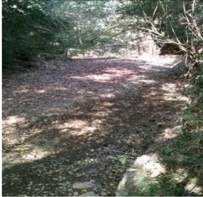
Cauce seco del rio Yotoco en parte urbana