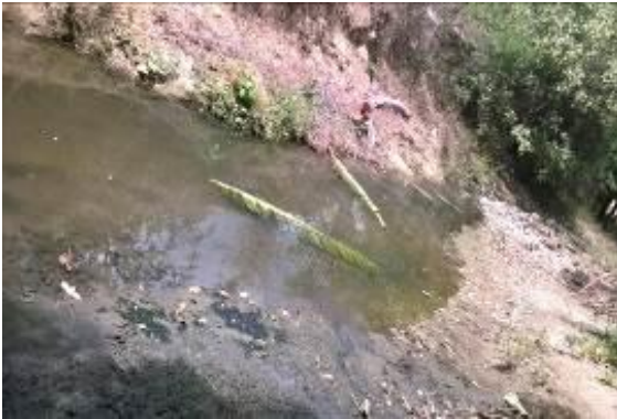
Rio Yotoco en zona urbana receptora de Vertimientos