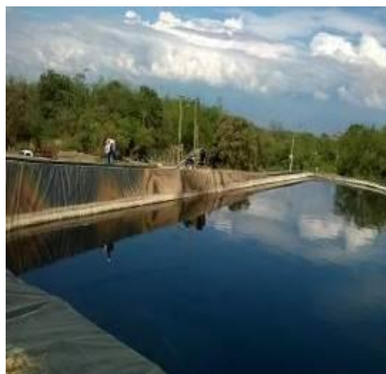
Fotografías 1, 2, 3 y 4. Almacenamiento de lixiviados a cielo abierto

El recorrido continúa en las celdas ya clausuradas. En éstas se observan deficiencias importantes como la falta de empradización de los diques que ha generado erosión en la mayoría de las paredes, a tal punto que se observaron residuos descubiertos (ver fotos 5 y 6)