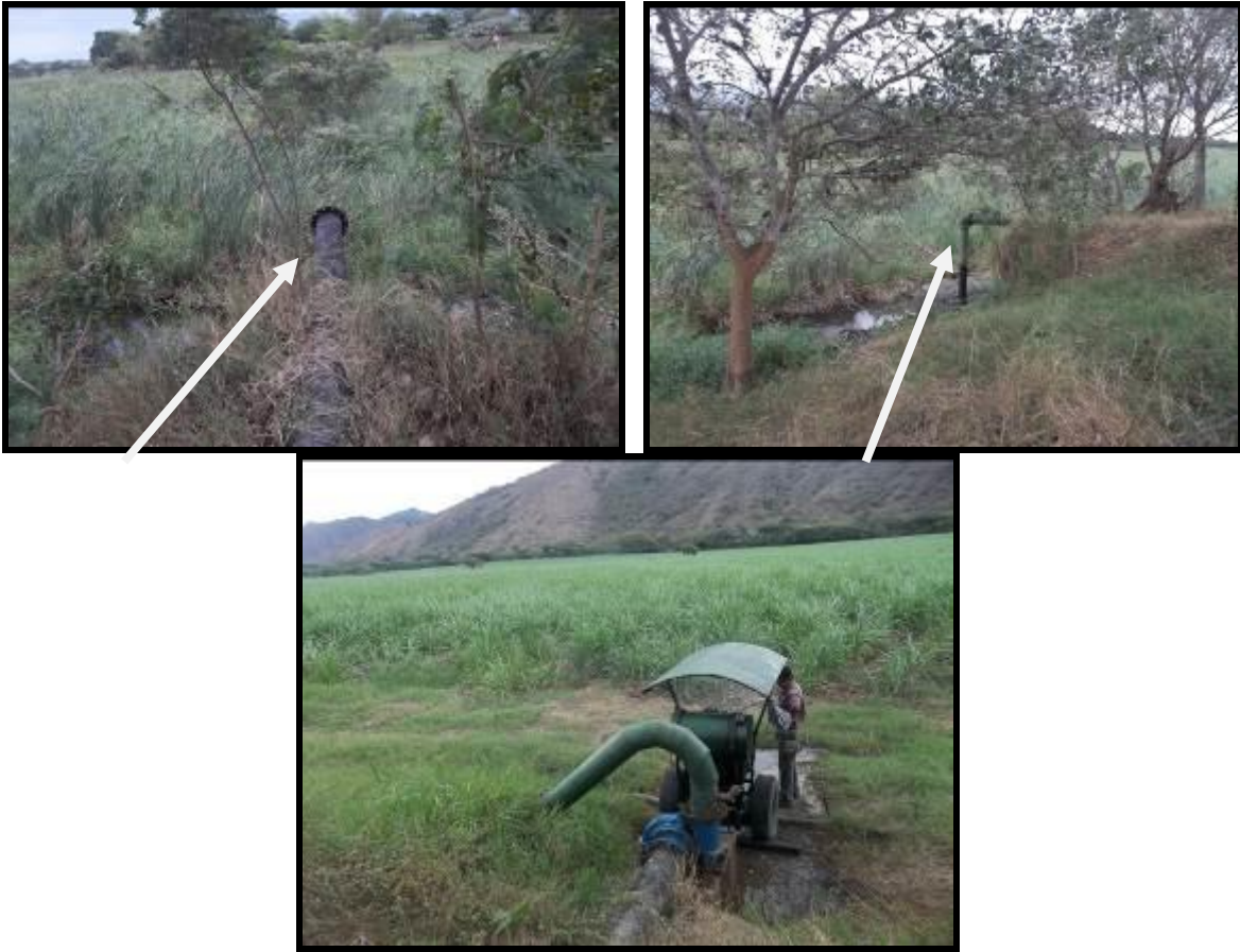
Equipos de bombeo instalados en áreas de humedales