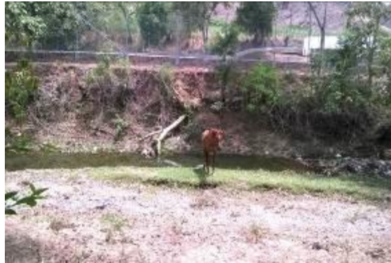
Cauce del rio sin conservación de la zona protectora