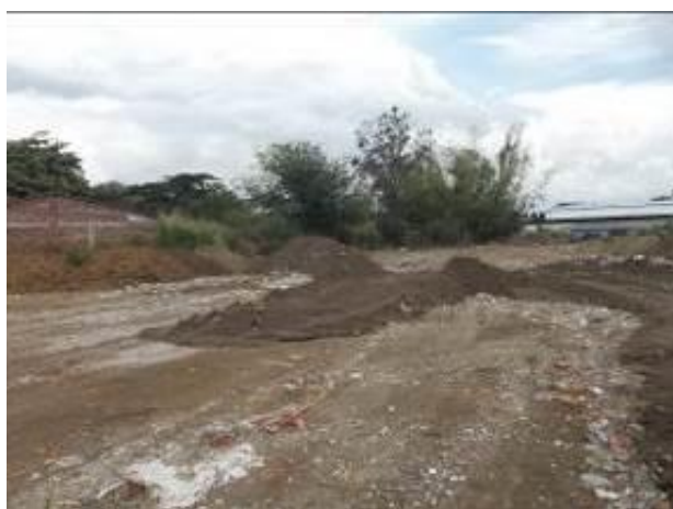
Predio utilizado actualmente por el municipio para la Disposición final de escombros