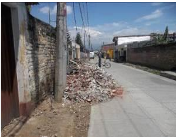
Disposición de escombros de construcción en área Urbana (permaneció durante el tiempo de auditoría)