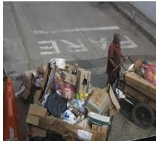
Labores de reciclaje informal en zona urbana