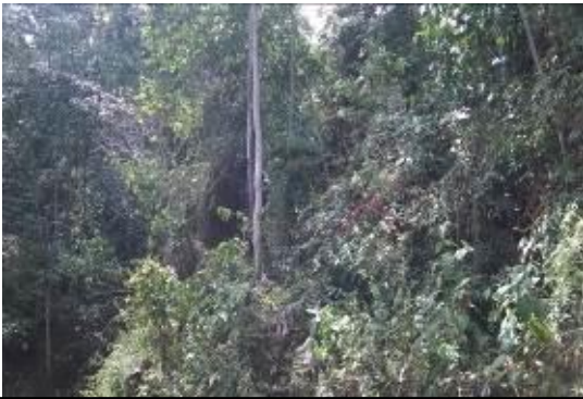
Aislamiento Finca Los Lagos, área de microcuencas de la Quebrada Negritos, Vereda Buenos Aires. Corregimiento El Dorado. (Se puede apreciar el alambrado en perfecto estado y la delimitación)

En recorrido efectuado a la zona intervenida con los aislamientos, de manera aleatoria se evidencian aislamientos, para lo cual se contó con el acompañamiento de funcionario de la Umata y personal de la Asociación.