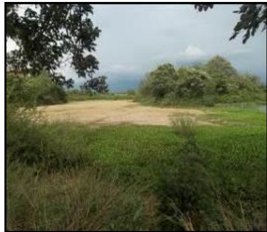
Procesos de pérdida del espejo lagunar –presencia de vegetación invasiva