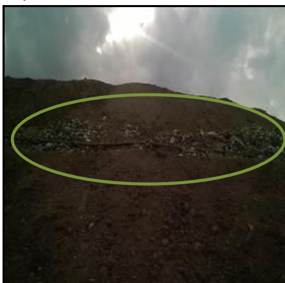
Fotos 5 y 6. Paredes de Diques erosionadas, descubriendo los residuos sólidos

Por su parte, a simple vista el material de cobertura final utilizada en la clausura no parece ser arcilloso y su compactación no es óptima, incumpliendo con lo establecido en el RAS 2000, pero además poniendo en riesgo la estabilidad de los diques, especialmente en la temporada de invierno, toda vez que las aguas lluvias