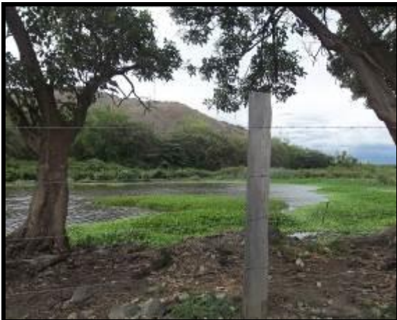
Proceso de eutrofización y desecación