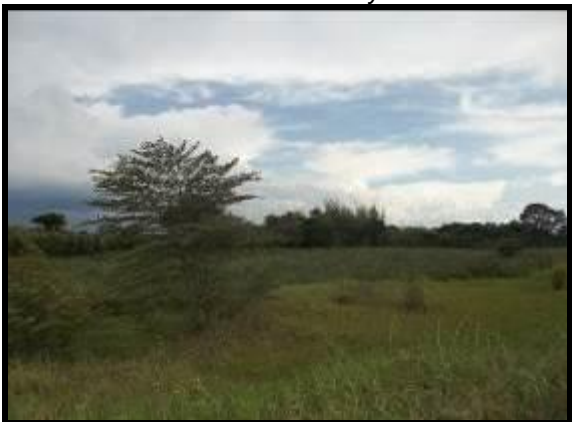
Pérdida del espejo lagunar y por ende impacto a las funciones ecosistémicas