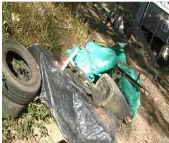
Disposición inadecuada de residuos en zona de influencia del Río Yotoco en área urbana