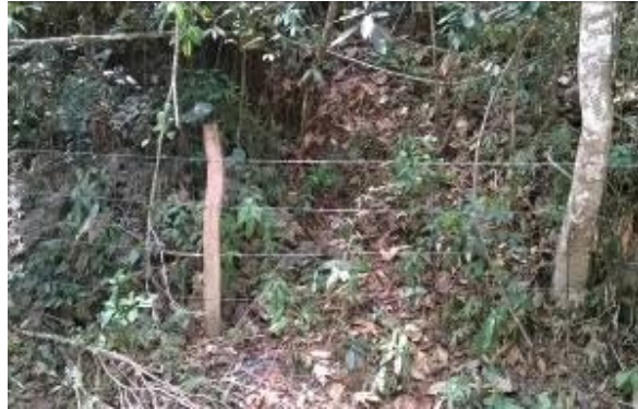
Cobertura boscosa de la microcuenca, Quebrada Negritos. (Durante la visita se evidencio que dicha Quebrada está seca.)