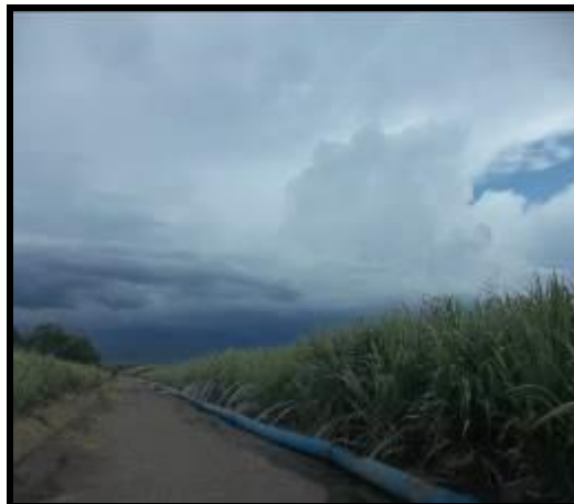
Riego de caña con agua de humedal