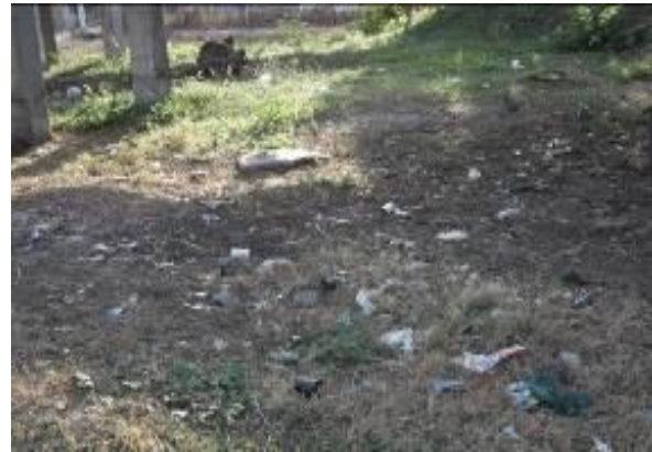
Disposición de residuos sólidos ordinarios en área de puente peatonal vía a Cali (zona urbana municipio)