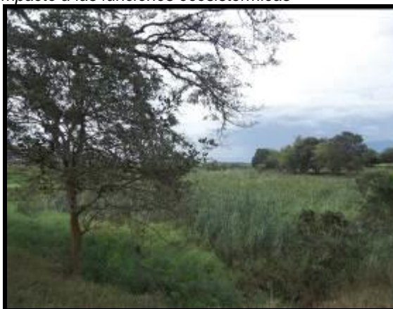
inexistencia de espejo lagunar-cambios en el uso del suelo