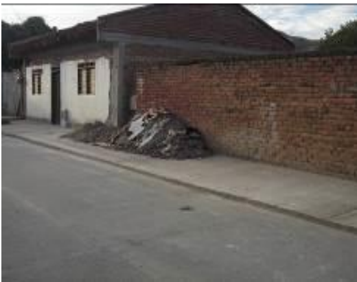
Disposición inadecuada de escombros de Construcción en zona urbana

Presuntamente el municipio realiza el manejo de los residuos sólidos, sin orientarse a cabalidad a los lineamientos de la política de gestión integral de residuos sólidos, Presunto incumplimiento Art. 4, 8, 9, 12,13, 14, 15, 16 Decreto municipal No.33 de 2005; Título III -Gestión integral de los residuos sólidos del Decreto nacional 2981 de diciembre 20 de 2013; Art. 65 numeral 9 Ley 99 de 1993.