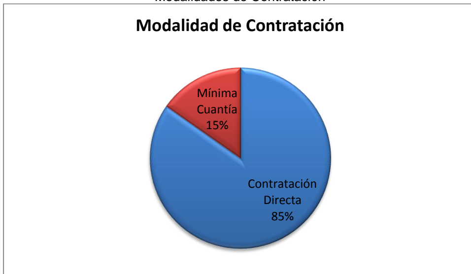
Grafico No. 1 Modalidades de Contratación

Fuente: Sistema de Rendición de Cuentas en Línea –RCL Elaboró: Dirección Técnica de Infraestructura Física