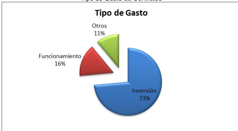
Grafico No. 3 Tipo de Gasto de Contratos