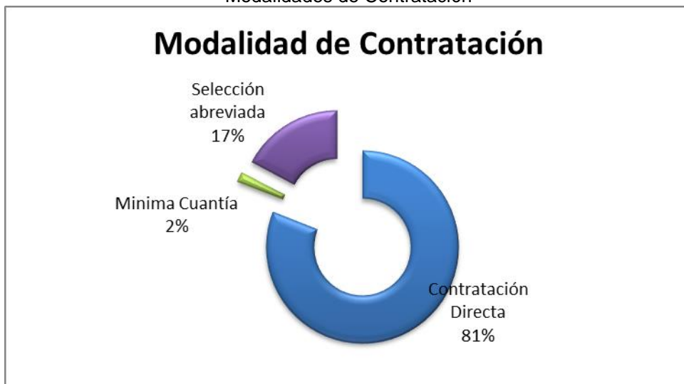
Grafico No. 1 Modalidades de Contratación