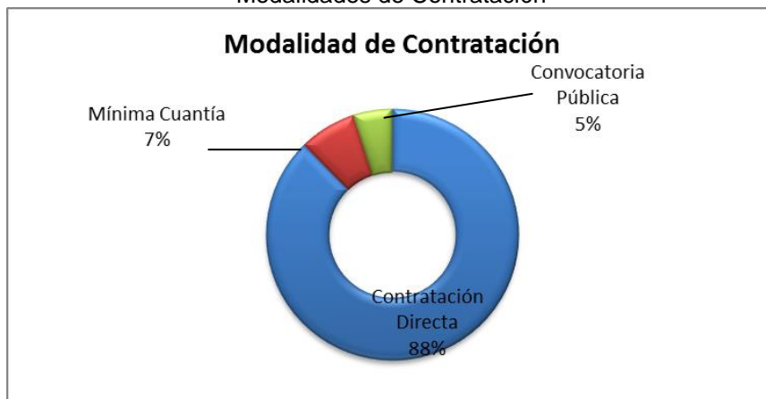
Grafico No. 1 Modalidades de Contratación

Fuente: Sistema de Rendición de Cuentas en Línea –RCL Elaboró: Dirección Técnica de Infraestructura Física