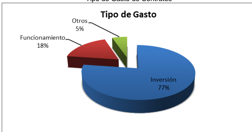
Grafico No. 3 Tipo de Gasto de Contratos

Fuente: Sistema de Rendición de Cuentas en Línea –RCL Elaboró: Dirección Técnica de Infraestructura Física