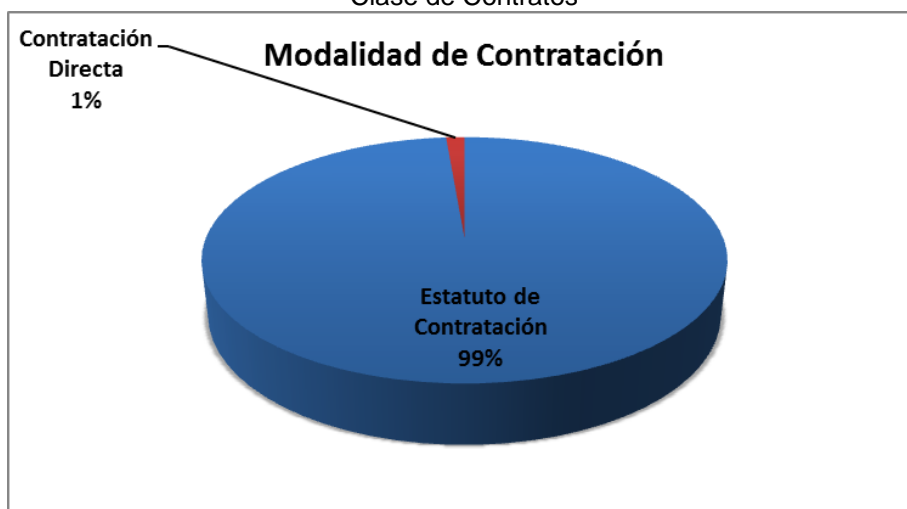
Grafico No. 1 Clase de Contratos

Fuente: Sistema de Rendición de Cuentas en Línea –RCL Elaboró: Dirección Técnica de Infraestructura Física