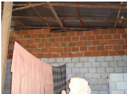
Muro culata falta continuidad y cinta

A pesar que son remodelaciones para albergues temporales de desplazados por el invierno, viven de forma precaria y antihigiénica, evidenciando que es una solución de paso que a futuro se devolverá al municipio y el deterioro en esta construcción es acelerado.