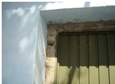
Marco de puertas con luces