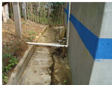
Canaleta perimetral sin revestimiento de paredes