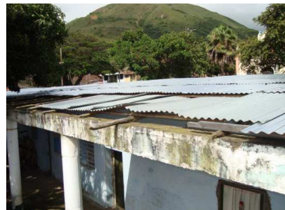
Teja traslazo deficiente