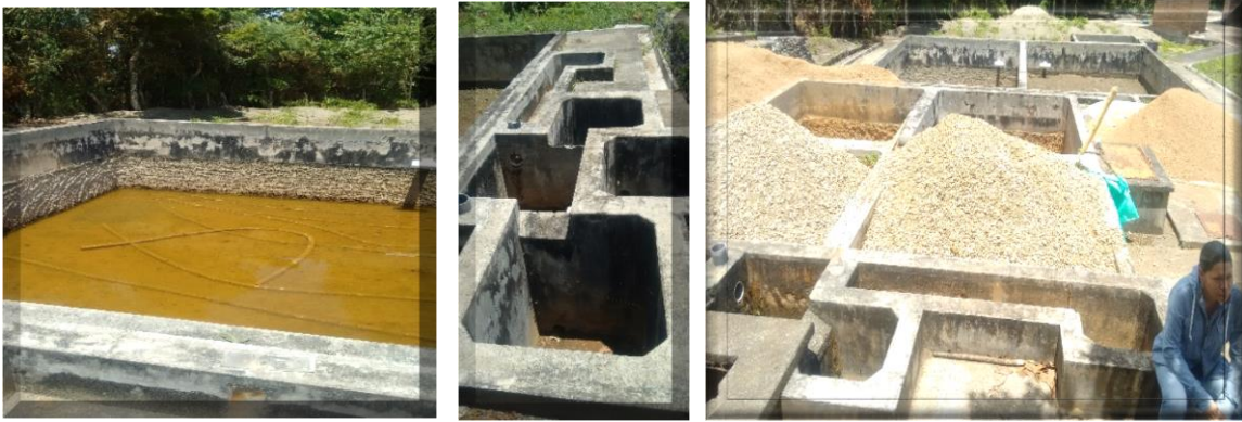
Fotos: Planta de tratamiento Quebrada Grande

Presentado deficiencias en la aplicación del Artículo 15 de la Resolución 2115 del 2007, la cual establece que cuando el agua no es apta para el consumo humano, debe haber gestión directa de acuerdo a su competencia de la persona prestadora, alcaldes y gobernadores.