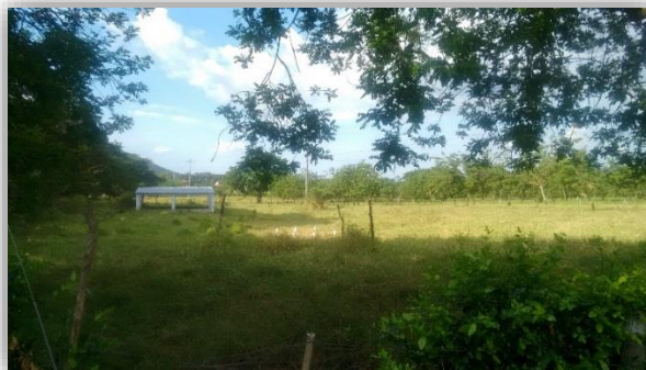
Planta de tratamiento de aguas residuales de San Luis (construida en el año 2012)

Este caso ya fue fallado por la Contraloría Departamental del Valle del Cauca expediente SOIF 007-2014.