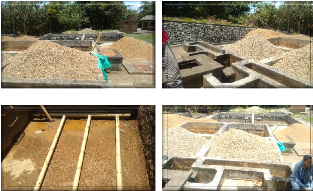
Fotos: Planta de tratamiento Quebrada Grande

Les cobran bimensual a los suscriptores la siguiente tarifa: