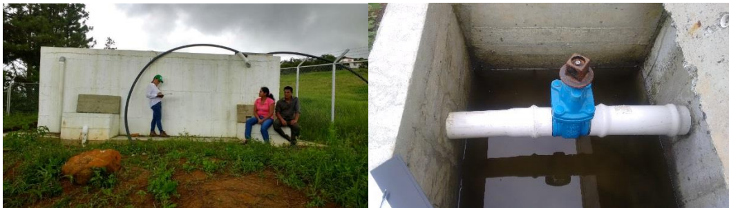
Acueducto de Ocache

El acueducto de Vidal y Ocache tienen que bombear el agua, lo que hace más costoso el tratamiento.