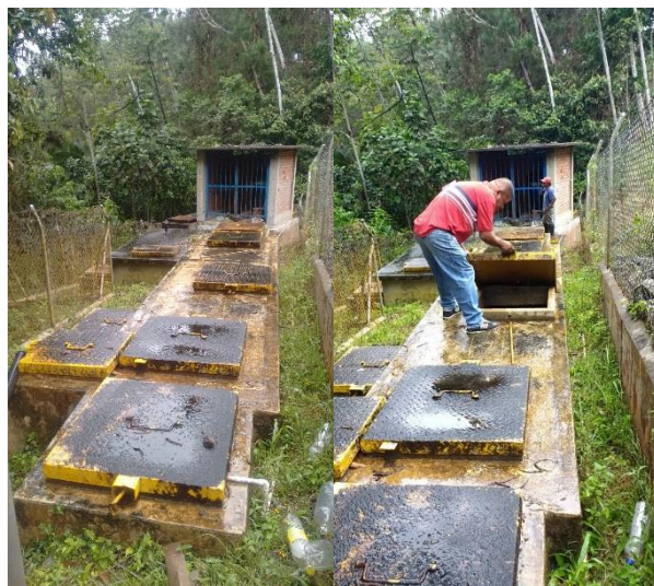
Acueducto la Rivera

El acueducto de Vidal y Ocache tienen que bombear el agua, lo que hace más costoso el tratamiento.