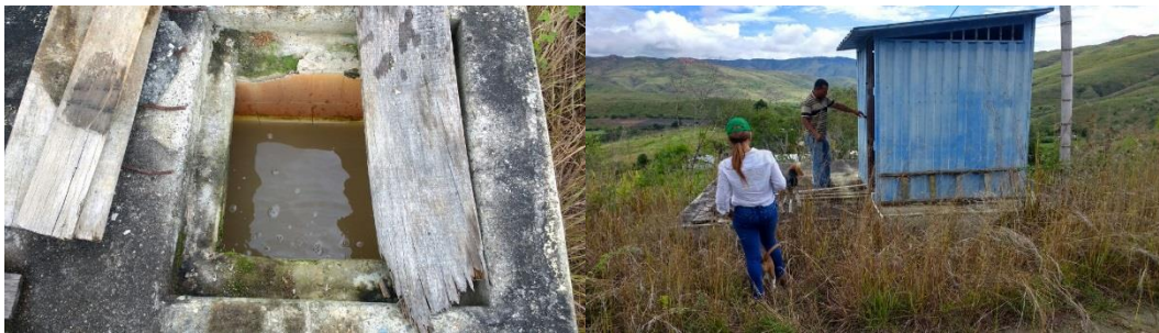
Acueducto de Mozambique