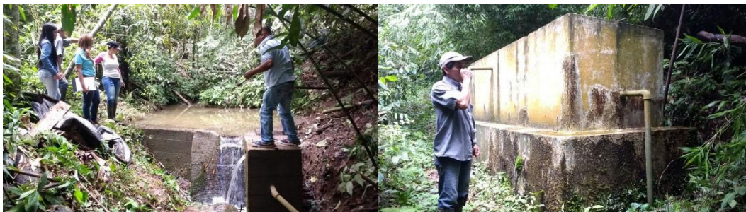
Acueducto de Pueblo Nuevo

En la visita realizada a los acueductos rurales de Caimital, Carbonero, El Tambor 11, La Fresnada, La Rivera, La Pedrera, Pueblo Nuevo, Mozambique, Vidal y Ocache, se observó que todos los sistemas están compuesto por bocatoma, desarenador y tanque de almacenamiento. La mayoría tiene caseta de cloración, pero no realizan la cloración por los costos, ya que no se recuperan por vía tarifa.