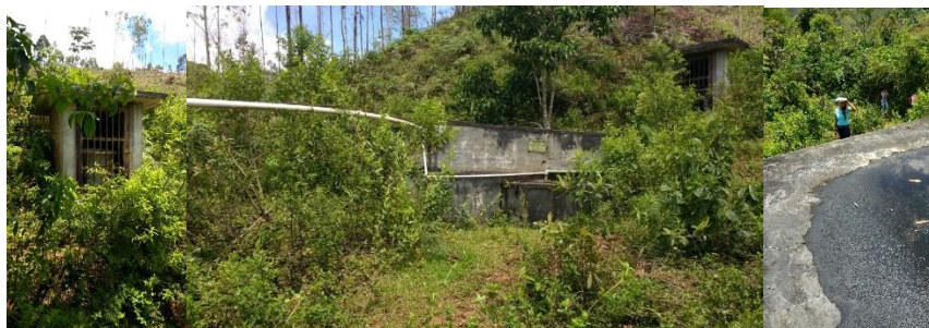
Acueducto La Fresnada