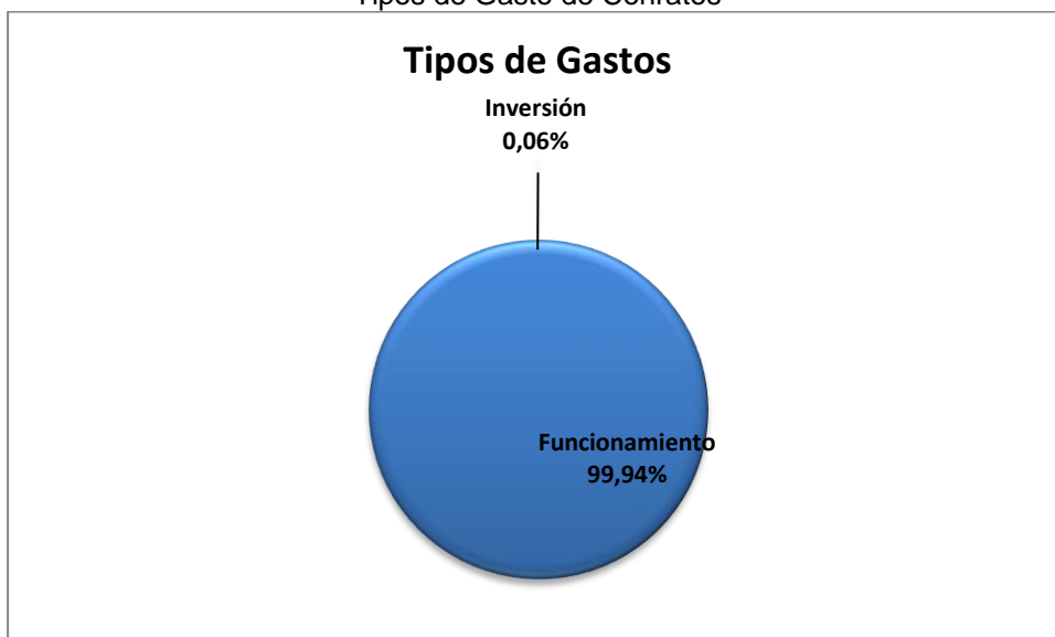
Gráfico No. 2 Tipos de Gasto de Conratos

Fuente: Sistema de Rendición de Cuentas en Línea –RCL Elaboró: Dirección Técnica de Infraestructura Física