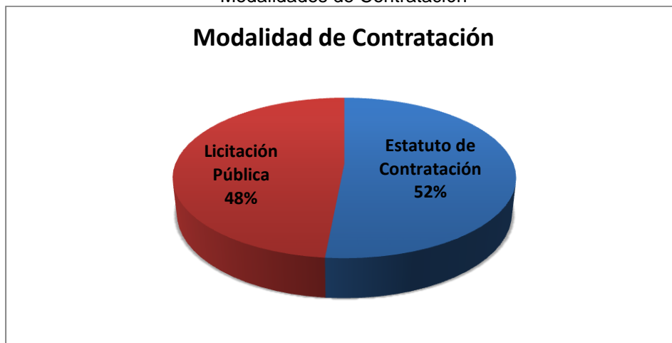
Gráfico No. 1 Modalidades de Contratación