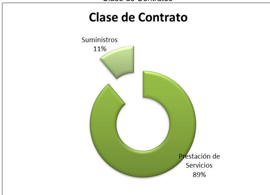
Grafico No. 1 Clase de Contratos