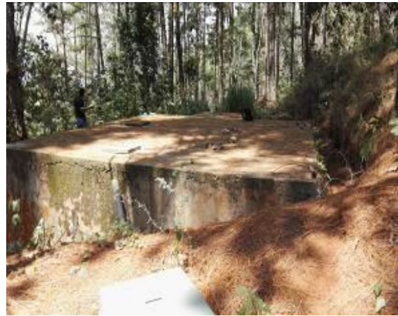
Derivación antes del desarenador de la vereda Aguas Claras – Sistema de tratamiento de la Vereda