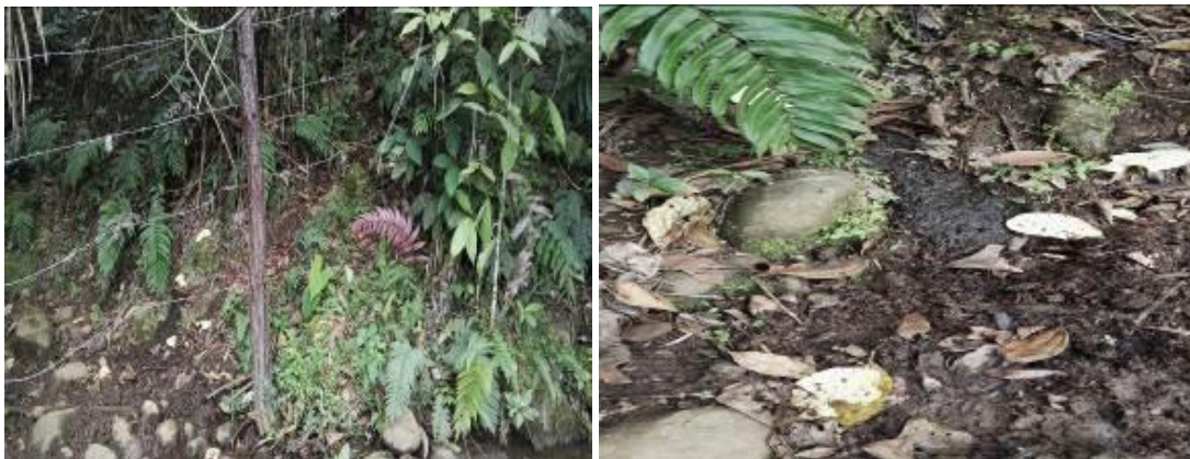
Deterioro del aislamiento y presencia de Excremento de ganado al Interior del Predio del Municipio