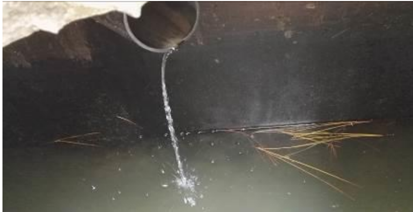
Cantidad de agua que ingresa al Sistema de tratamiento de la comunidad