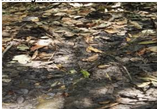
Estado Actual Quebrada Aguasclaras