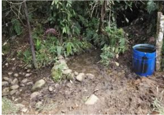
Huellas de Ganado al Interior del Predio y Bebedero del ganado en el Cauce de la quebrada