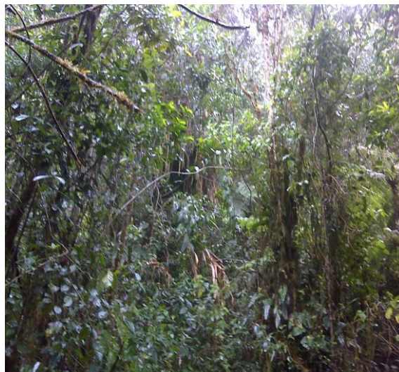
Vereda la hermosa pródigo el danubio