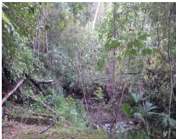
Pródigo sin nombre ubicado en la vereda de barranco bajo