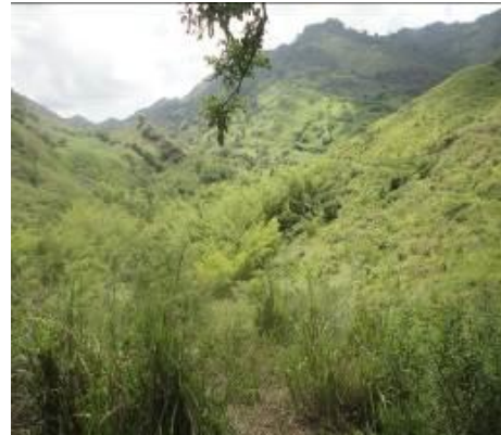
Predio de la alzacía comprados en el año 2013, 14, y 15, falta mantenimiento de reforestación