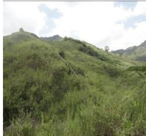
Predio la golondrina comprado vigencia 2012, falta mantenimiento de reforestación