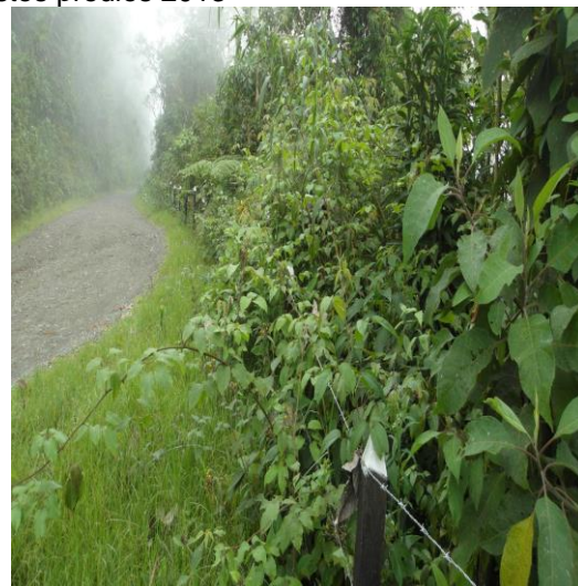
Aislamiento de terrenos para evitar el paso al ganado