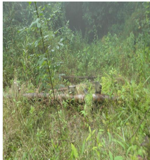
Trinchos para evitar erosión en estos predios 2013