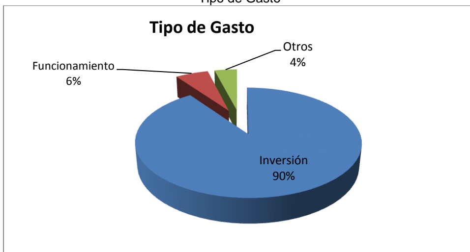
Grafico No. 3 Tipo de Gasto

Elaboró: Dirección Técnica de Infraestructura Física