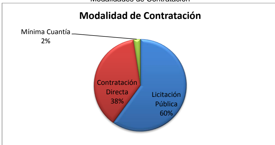
Grafico No. 1 Modalidades de Contratación