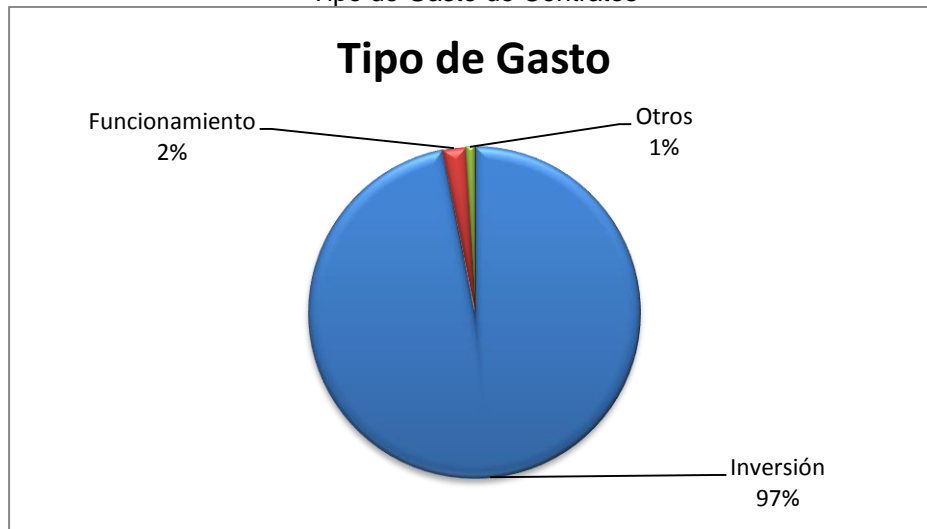
Grafico No. 3 Tipo de Gasto de Contratos

Fuente: Sistema de Rendición de Cuentas en Línea –RCL Elaboró: Dirección Técnica de Infraestructura Física