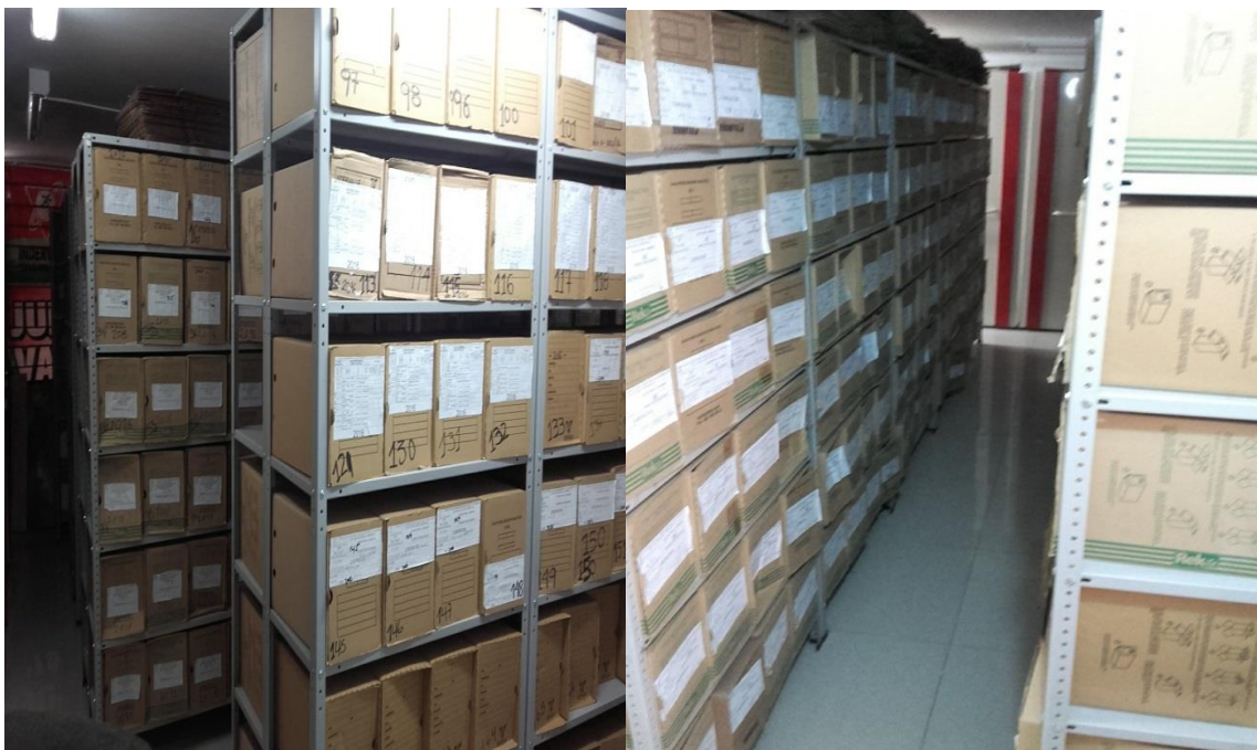
IMÁGENES DEL ARCHIVO CENTRAL

los tiempos de retención y permite a la administración proporcionar un servicio eficaz y eficiente.