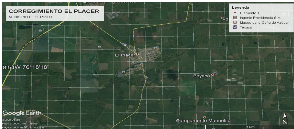
Ilustración 3. Localización corregimiento el placer - Municipio De El Cerrito

El Municipio de El Cerrito se localiza al norte del municipio de Cali-Valle del Cauca, las obras fueron ejecutadas en el corregimiento el Placer.