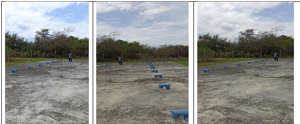
Ilustración 5. Registro fotográfico visita fiscal

De acuerdo a la visita realizada el día 23 de septiembre de 2020 se pudo evidenciar que se lograron realizar las actividades pactadas en la minuta contractual, las cuales se muestran en el siguiente registro fotográfico: