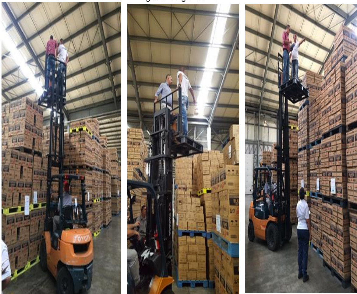
Registro fotográfico No. 1

Visita al almacenamiento de las unidades producidas de la Industria de Licores del Valle, verificación de la información en compañía del personal de bodega.