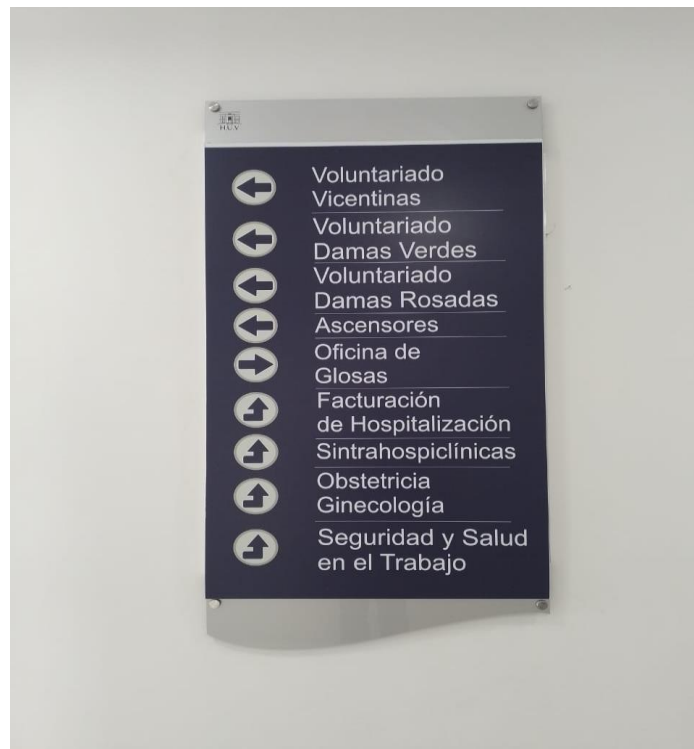
Oficina de Glosas

De acuerdo a visita fiscal realizada a las instalaciones del Hospital Universitario del Valle – HUV “Evaristo García”, en las oficinas de glosas y facturación, se observó lo siguiente: