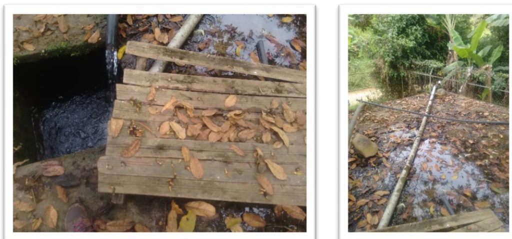
Registro fotografico Acueducto San Jose