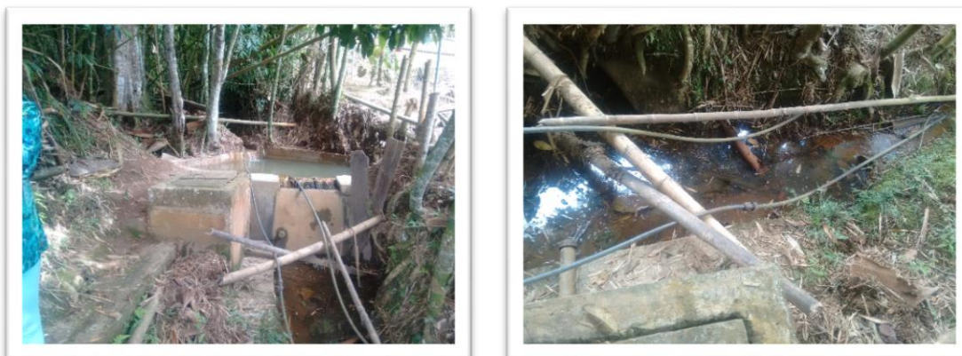
Registro fotografico Acueducto Jiguales

sanitarias. Lo que ocasiona la posibilidad de incrementar los riesgos de contraer enfermedades de origen hídrico en la comunidad.