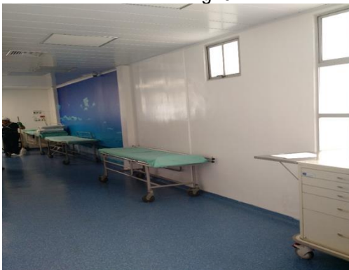
Área de preparación Imágenes San José