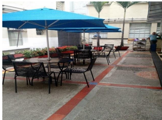
Área de la construcción ocupada con mesas a lado y lado