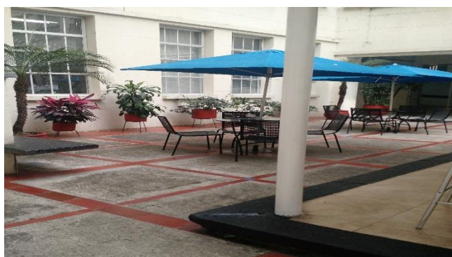
Área de entrada medida y ocupada con las mesas

Cada una de las áreas tiene sus documentos que confirman lo evidenciado y calculado, por lo anterior se puede aplicar a todas las áreas que están en arrendamiento por parte del hospital.