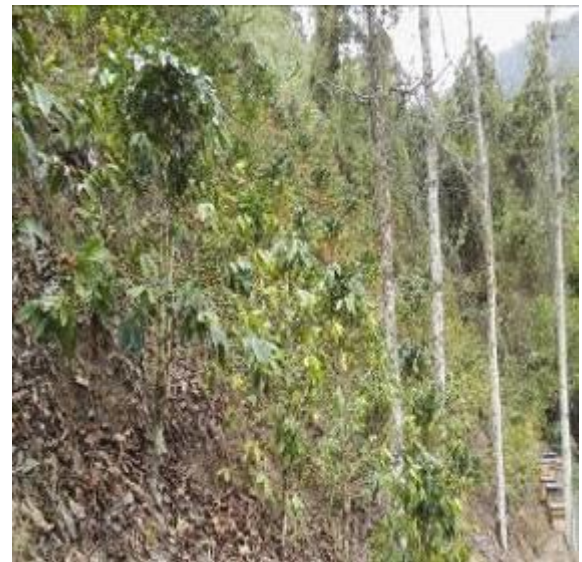
Actividades antrópicas al interior del predio adquirido por el Municipio y deterioro del aislamiento