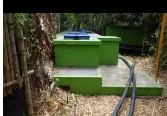
Predio la suiza, y tanques de almacenamiento del acueducto del pie y de rey