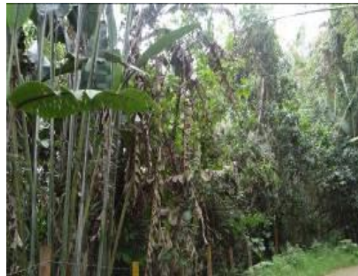
Predio de bellavista donde se evidencia aislamiento, pero no con vallas alusivas a que son propiedad del municipio