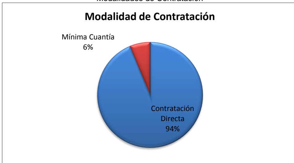
Grafico No. 1 Modalidades de Contratación

Fuente: Sistema de Rendición de Cuentas en Línea –RCL Elaboró: Dirección Técnica de Infraestructura Física