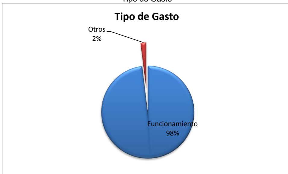
Grafico No. 2 Tipo de Gasto

Fuente: Sistema de Rendición de Cuentas en Línea –RCL Elaboró: Dirección Técnica de Infraestructura Física