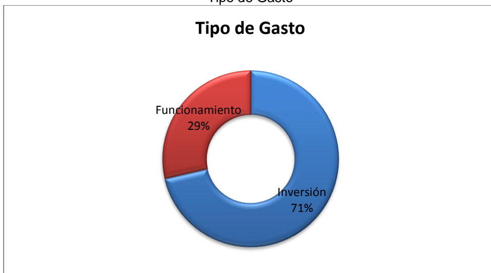
Grafico No. 3 Tipo de Gasto

Elaboró: Dirección Técnica de Infraestructura Física