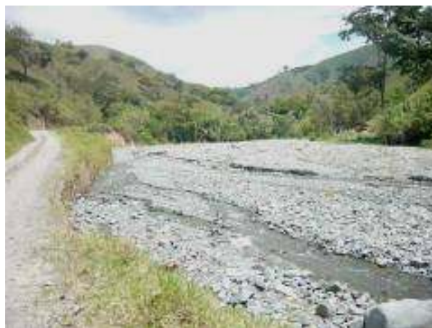
Cauce del rio San Pedro en la cuenca media, con mínimo caudal