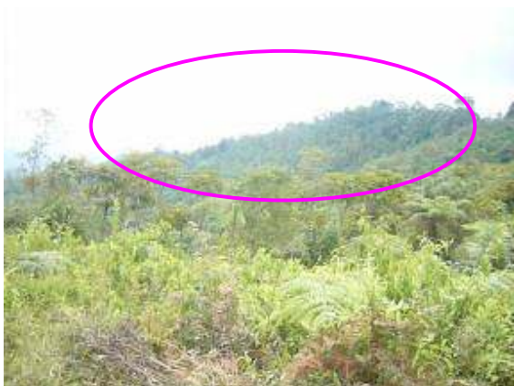
Vista del predio La Reina desde sector La Tribuna