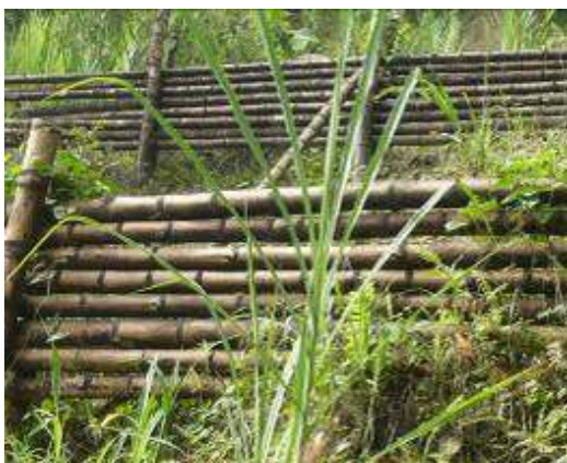
Trinchos en guadua recuperación áreas degradadas