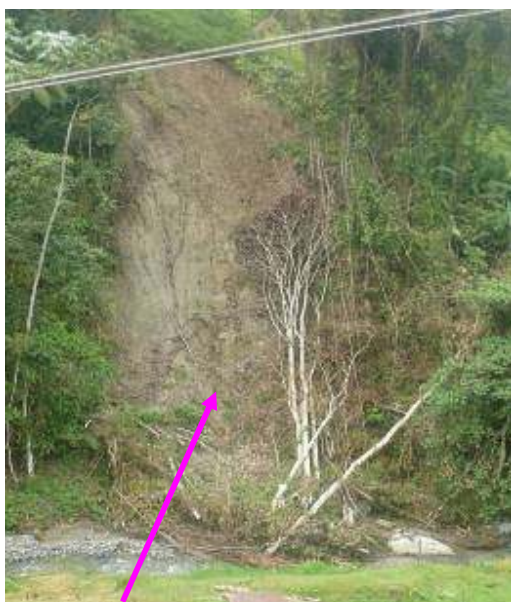
Desprendimiento masal a cauce de quebrada Area de influencia cuenca media rio Guadalajara

cauce. Se evidencia que el uso del suelo en la cuenca media es principalmente ganadera, se continúa la extracción de material de arrastre a todo lo largo del río, presuntamente sin controles. Ello evidencia la necesidad del ordenamiento ambiental de la cuenca con el objeto de destinar el uso de ésta, de acuerdo a su potencialidad y de manera concertada con los diferentes actores (HAD No.2)