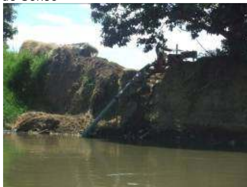
Motobomba-extracción de agua para riego