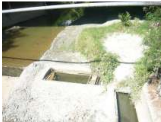
Quebrada Artieta (río San Pedro), a su paso por el casco urbano del municipio, obsérvese color de sus aguas, escaso caudal y aforos