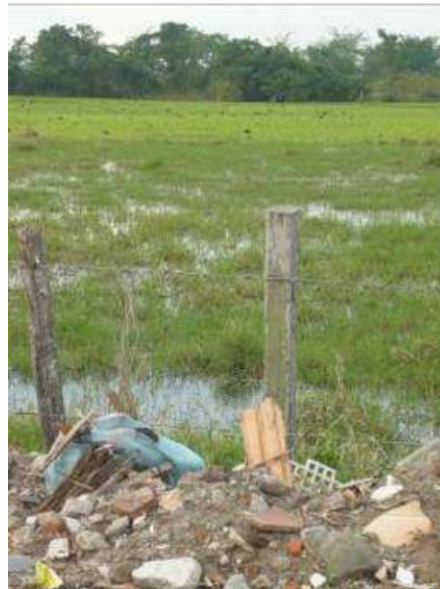
Presencia de cantidades de escombros de material de construcción y basuras