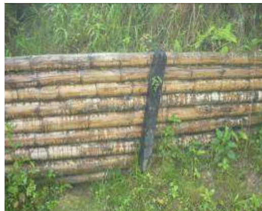
Construcción de Trinchos