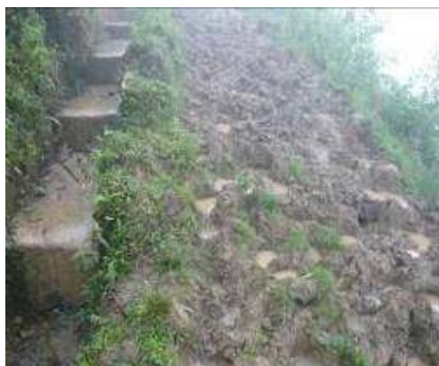
Pisoteo de ganado en el predio intervenido No se suscribió acta de compromiso con propietario