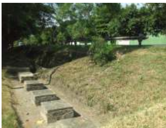
STAR vereda Pantanillo, objeto de Mantenimiento

Del análisis anterior se establece que las STARs visitadas objeto de mantenimiento a través de OT No.01, 03 del 2007 y No.04 del 2008, a excepción de la existente en la vereda Pantanillo, no están cumpliendo el objetivo de minimizar las cargas contaminantes que se vierten a las fuentes hídricas, por cuanto los residuos generados en su limpieza, se están arrojando a los suelos y cuerpos de agua, con el consiguiente riesgo para la salud humana, sin ningún control por parte de la Administración Municipal (se determina como un hecho mas del hallazgo administrativo disciplinario No.4)