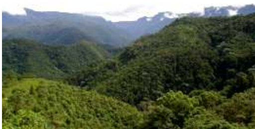
Predio la Albania

egreso 1925 de diciembre de 2004. Así mismo en la vigencia 2005 se afectan $10.000.000 para el pago de una cuota del predio con recursos de regalías - sector eléctrico y los demás pagos con recursos del Sistema General de Participaciones propósito General. En estas cuotas se cancelan también los intereses. Con lo anterior se deduce que la adquisición de este predio no fue precisamente con recursos propios del municipio, excepto en la vigencia 2007 donde se cancela con recursos propios, la propiedad del municipio corresponde al 34,9% y el resto a la Corporación Autónoma Regional del Valle del Cauca (CVC), el cual tiene como uso de suelo tierra forestal, además se encuentra declarado como área de reserva protectora comprendido por ecosistema Sub – andino, 42 especies de aves, 12 especies de ranas y sapos, 4 especies de serpientes.