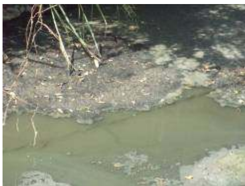
STAR corregimiento Guayabal