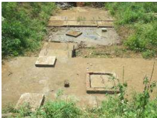
Pozo séptico San Antonio de Piedras