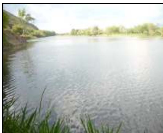
Humedal Maizena - Alejandria

Con referencia a proyectos de descontaminación del recurso hídrico en el EOT dispone como estrategia emprender gestiones para programas de saneamiento básico en la cabecera municipal y corregimientos como primer paso a una política subregional de descontaminación del Río Cauca. Se trazó así mismo que a partir del segundo semestre del 2001, destinar inversiones para la construcción del sistema de tratamiento de aguas residuales. Se propuso como meta para el periodo 2001 - 2006 gestionar recursos para la construcción de redes de alcantarillado, emisores y STARs en los corregimientos de Mediacanoa, San Antonio de piedras, El dorado, Jiguales, Puente tierra, El Caney, Las delicias y Rayito - Campoalegre