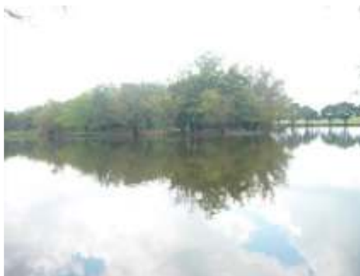
Humedales Roman Gota'e leche