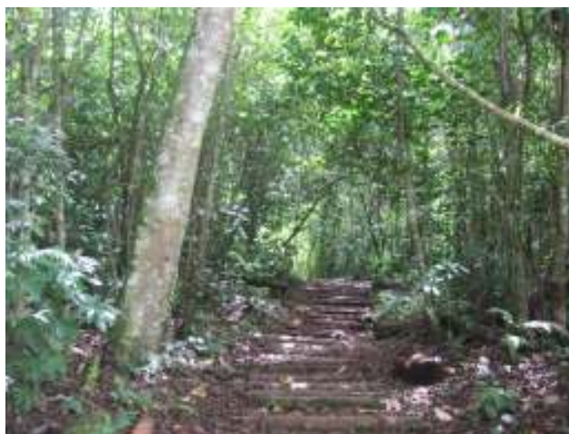
Sendero ecológico de la reserva forestal bosque de yotoco

El 35% de la cuenca presenta un grado de erosión severa. En la cuenca se encuentran dos ecosistemas del valle geográfico (bosque seco tropical y humedales), el bosque subandino seco y la Reserva Forestal Nacional de Yotoco con 559 Ha. (CVC- Proagua 2008 convenio de asociación).