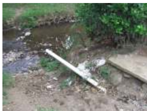
Asentamiento subnormal urbano B/ La inmaculada, con vertimientos directos al río. No se conservan los 30 m a lado y lado de la margen