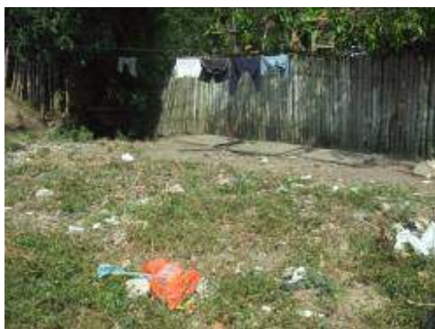
STAR corregimiento Agüitas

En visita de campo a la STAR del corregimiento Guayabal se observó que el vertimiento va a la quebrada San Pedro y para el caso de Agüitas, a una quebrada cercana, así mismo estas aguas servidas y lodos, provenientes de los mantenimientos, son arrojados directamente al cuerpo de agua, causando un daño al ecosistema y al recurso hídrico, incumpléndose con el objetivo para el cual fueron construidos estos sistemas, de remoción de cargas contaminantes para el mejoramiento de la calidad del recurso hídrico y la salud humana, constituyéndose por el contrario, en un foco de contaminación del agua y riesgo sanitario.