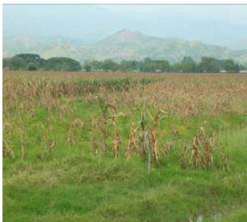
Cultivos de maíz invadiendo Humedal