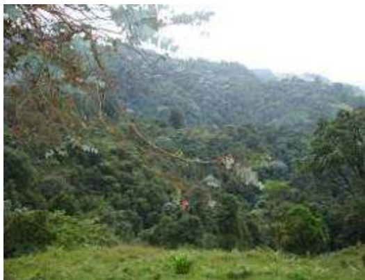
Vista general del Predio El Prado