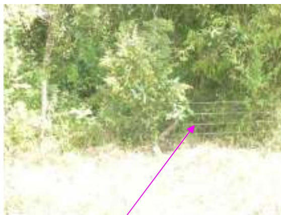
Trabajos de aislamiento y siembra para la conservación recurso hídrico quebrada La Grecia Finca La Linda

En la vigencia 2008 el Municipio ejecuta gastos por $5.585.650 en compra de materiales, transporte de los mismos, sin que se evidencien actos administrativos que soporten la erogación, como tampoco los soportes que evidencien el cumplimiento de dichas actividades, recibos del bien o servicio por parte de la comunidad o juntas directivas, a fin de identificar su cumplimiento, se limita para las visitas. Se determina como un hecho más del HA-12.