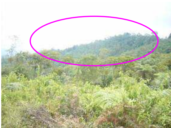
Vista del predio La Reina desde sector La Tribuna