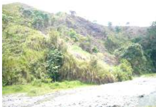
Áreas de ladera desprotegidas de cobertura vegetal por procesos erosivos ocasionados por actividad ganadera, afectando la regulación hídrica