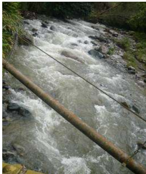
Cuenca media Río Guadalajara

En los Planes de Desarrollo citados anteriormente, el municipio no incorporó el Programa de uso eficiente y ahorro del agua, como lo estipula el parágrafo 1 o del artículo 3 de la Ley 373 de 1997, independiente de que éste se incluya en el Plan de Acción de la Empresa prestadora del servicio de acueducto (HA-3)