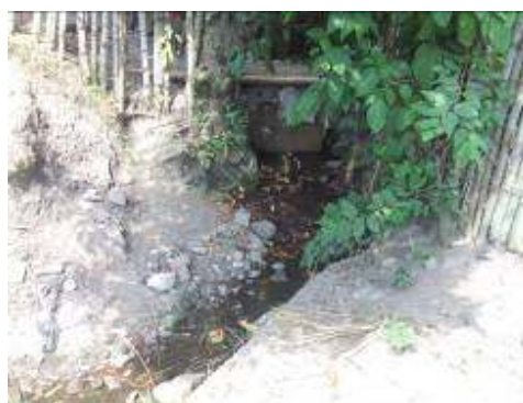
vertimiento proveniente de la STAR Agüitas