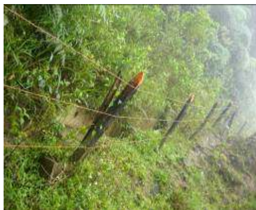
Cercas para protección del área degradada

- Contrato de obra pública SAF-029 de 2008 , cuyo objeto fue la realización control erosión en la Finca El Pensil, ubicada en la vereda La Primavera, consistente en construcción de trinchos, siembra de especies forestales nativas, gaviones y canaletas.