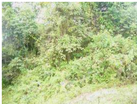
Predio La Reina –cgto. Buenos Aires