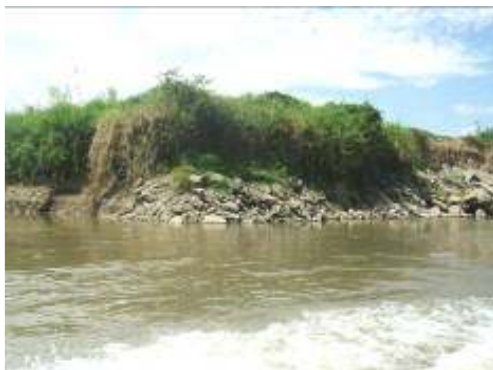
Presencia de gran cantidad de Escombros