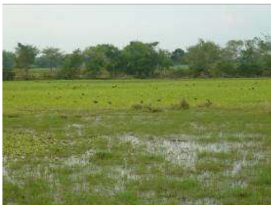
Pérdida del espejo lagunar humedal Tiacuante El Conchal

hallazgo administrativo No.1 para la actual Administración, a fin que se realice la gestión correspondiente.