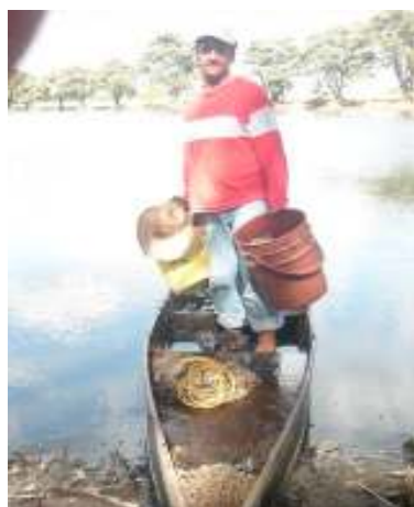
Labores de pesca artesanal