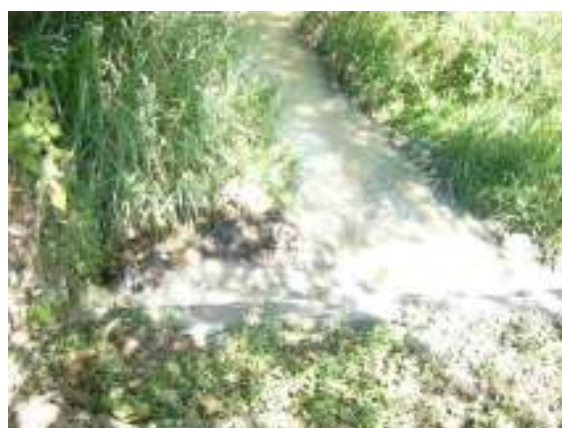
Punto de descarga del alcantarillado municipal a la quebrada el Yeso, que a su vez tributa al río Cauca