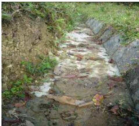
Trabajos de control de erosión - Canaleta