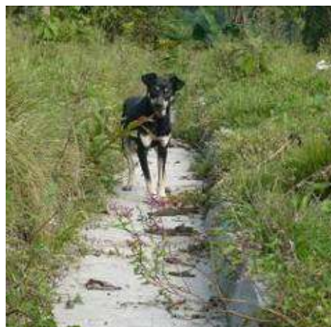
Canaleta para escurrentía de aguas lluvias-se observó falta de mantenimiento

Las inversiones realizadas por el Municipio para control de erosión de áreas degradadas, se efectuaron en predios privados en beneficio de las microcuencas tributarias del río Guadalajara, sin que se evidencien actas de compromiso con los propietarios para garantizar la sostenibilidad de la inversión. Lo aportado por la Administración actual corresponde a los informes de interventoría donde se presentan indicaciones a los propietarios, documentos no firmados por éstos, por tanto no se constituye en prueba de compromiso (HA-4)