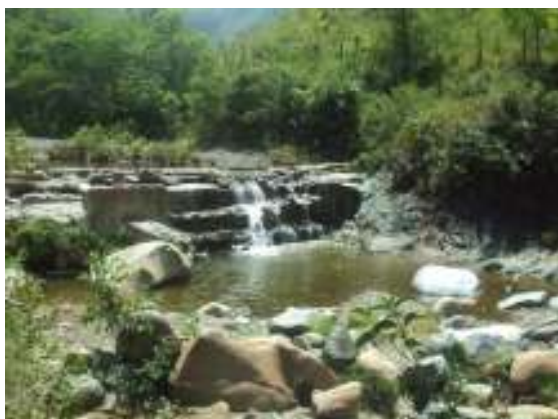
Parte rural río yotoco