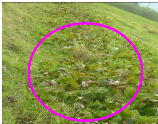
Vegetación invasiva-buchón de agua