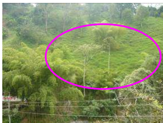
Procesos erosivos característicos de actividad ganadera