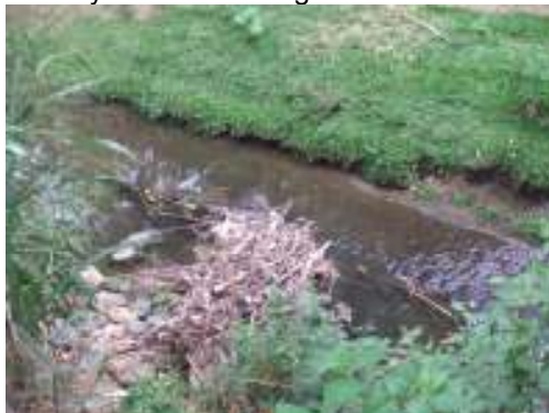
Cauce del río yotoco zona urbana B/ La inmaculada municipio con minino caudal