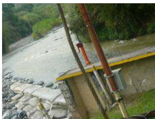
Rio Guadalajara a la altura de la bocatoma del acueducto Municipal, administrado por Aguas de Buga