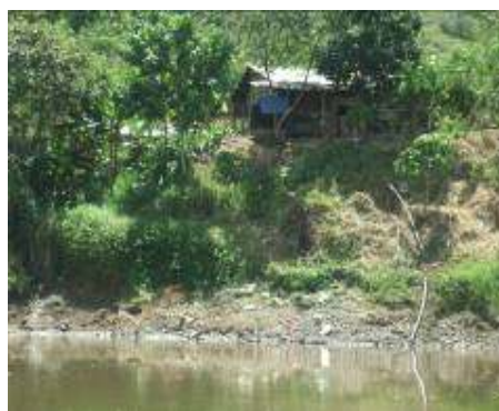
Caserío a orilla del Río Cauca