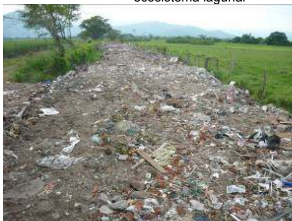
Grandes cantidades de escombros de construcción y residuos ordinarios en área del humedal Tiacuante

En lo referente a la declaración de los suelos de protección, en nacimientos y cauces de ríos, se observa que esta disposición no se ha cumplido cabalmente, puesto que en recorrido por la cuenca media y baja del río Guadalajara, se observaron altos impactos sobre la cuenca, hallándose grandes áreas donde no se están respetando los 30 metros que deben conservarse a lado y lado del