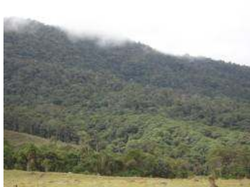
Predio La Cabaña

Por este concepto se ejecutaron $59.984.185 en control de áreas degradadas durante las vigencias evaluadas, evidenciándose: