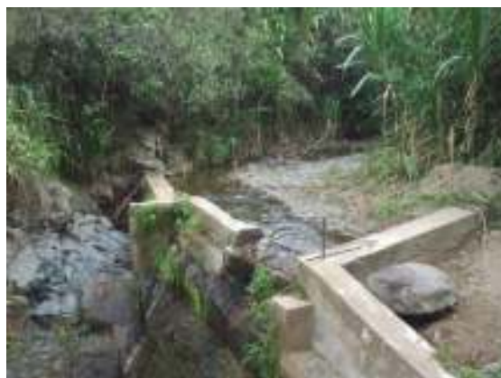
vista de la bocatoma acueducto municipal.