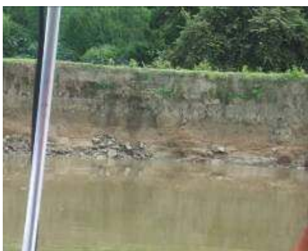
Procesos erosivos por acción del agua