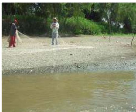
Actividades de pesca artesanal