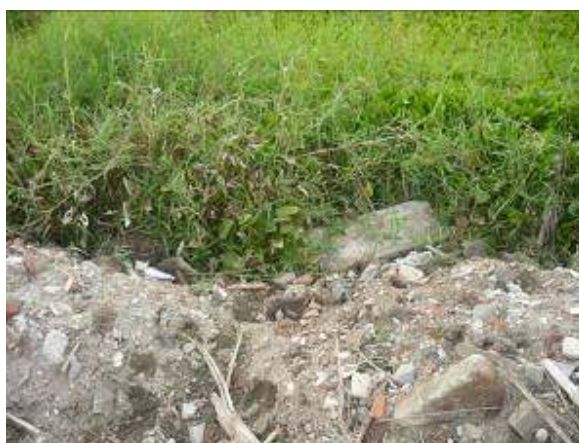
Escombros y basuras-grave afectación al ecosistema lagunar