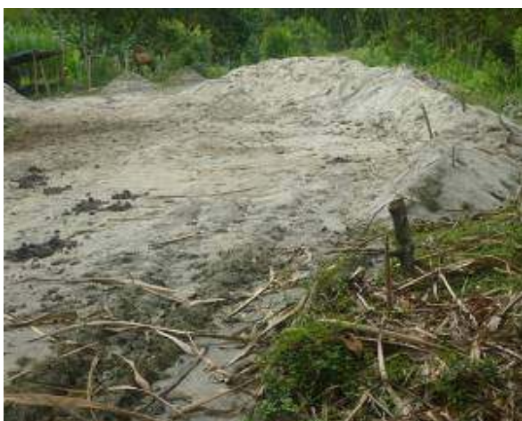
Extracción de material de arrastre río Guadalajara