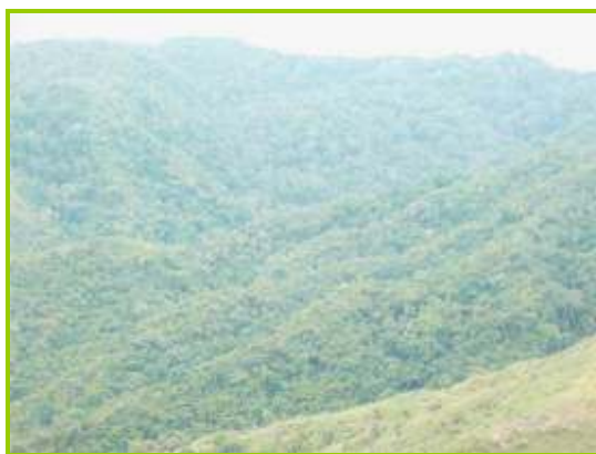
Vista general de la Reserva natural bosque de Yotoco.

-Convenio interinstitucional No.026 de 2007, suscrito con la Asociación de usuarios ríos Yotoco y Mediacanoa – ASOYOTOCO, por $25.700.000, con la finalidad de realizar acciones tendientes a la implementación del proyecto de conservación y aumento de la cobertura vegetal en la zona amortiguadora de la reserva forestal bosque de Yotoco - Predio Calimita uno, cuenca río Yotoco, cuyas obligaciones era la de socializar el proyecto a la comunidad del municipio de Yotoco, construcción de un kilómetro de aislamiento, siembra de 3200 árboles en la zona aislada como restauración de las 17 hectáreas que comprende el predio Calimita uno y realizar jornadas de recolección y extracción de contaminantes como residuos sólidos en el área de influencia de la cuenca río Yotoco con apoyo de organizaciones de base comunitaria. En visita de campo se observó el área objeto de aislamiento, sin embargo se limitó verificar la reforestación en ésta. Esta inversión se constituye en beneficio para la cuenca del río Yotoco, por cuanto aumenta el área de la Reserva forestal.