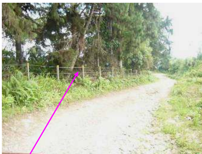
Reparación de cercos realizados en el 2007 -limite del predio La Reina, Zona alta de la cuenca río San Pedro

-Contrato de obra No.240 del 2008, suscrito con Fundaguadua por $60.000.000, dentro del Programa Repoblación zonas protectoras, con el objeto de realizar Obras para la corrección y mitigación de la erosión y remoción masal y carcavamiento presente en el predio “La Tribuna”, microcuenca de la quebrada Artieta. No se evidenció acta de compromiso con el propietario del predio, con el