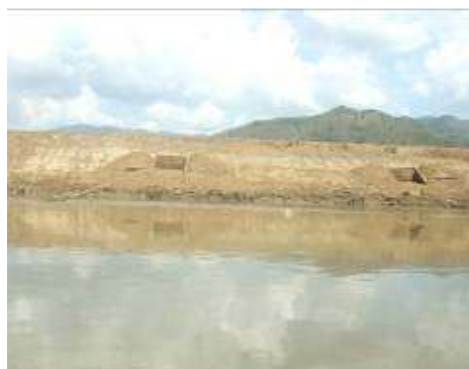
Dique de 400m para protección de la Laguna de Sonso