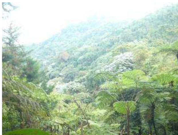
Predio La Reina, Reserva forestal

Se evidenció así mismo en área adyacente al predio La Reina, área adquirida por el municipio en el 2006 denominado La Manga.