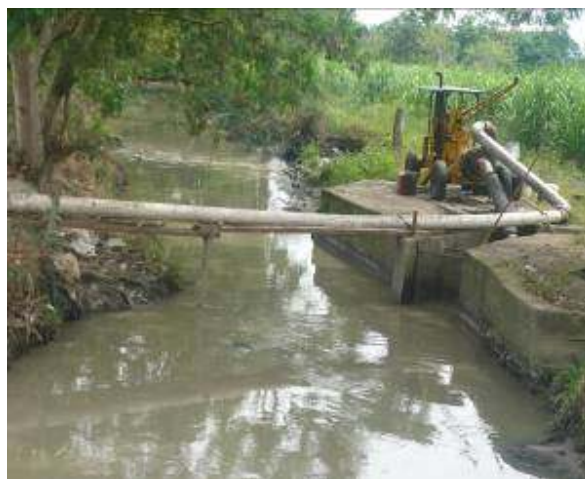
Zanjón Tiacuante-receptor de las Aguas residuales del sistema de alcantarillado del municipio de Buga previo a la descarga al Río Cauca