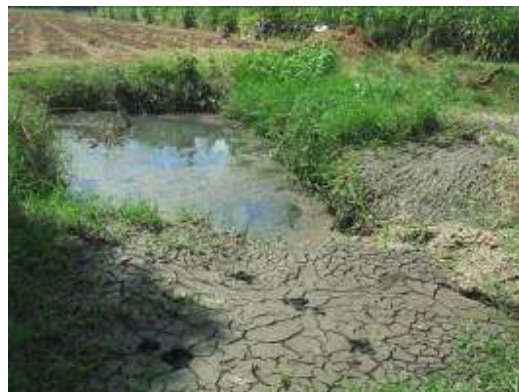
Sitio de disposición de lodos y aguas servidas

Contrato 121 del 2008 para el mantenimiento de pozos sépticos escuela del corregimiento de Buenos aires y cordobitas por $2.400.000, no se establecen en el contrato el sitio autorizado para la disposición de los materiales producto de la limpieza. No se evidenció un informe de seguimiento por parte de planeación solo el oficio para la autorización del pago final. En el registro fotográfico que presentan como soporte de las actividades, no se incluye el estado del pozo antes de su mantenimiento que permita determinar los trabajos realizados, no hay certificaciones de las instituciones educativas beneficiadas de recibo a satisfacción. (HA-8)