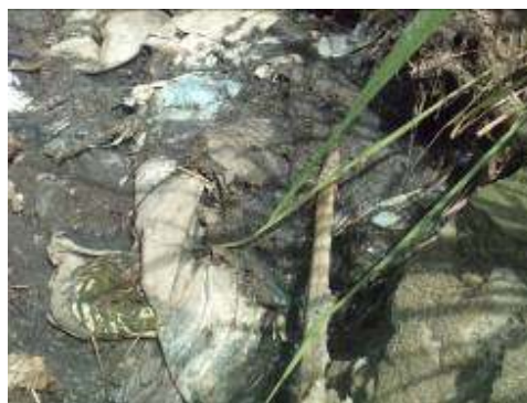
vertimiento a la Quebrada San Pedro

-Se evidenciaron presuntas irregularidades en el cumplimiento del contrato de consultoría No.04 de 2007, por $14.000.000, cuyo objeto fue la elaboración del diseño y estudio de PTAR del corregimiento de San José, por cuanto su producto es un informe ya realizado por el mismo contratista en la vigencia 2004, en el cual solo se modifican las fechas, además, el contratista no presentó planos de ubicación del predio, levantamiento topográfico, datos actualizados de la población, caudal, carga contaminante y demás indicadores necesarios para estos diseños, esto aunado al hecho que a la fecha de la auditoria no está construida la PTAR en esta vereda, lo cual se determina como una presunta mala gestión, debido a que el Municipio realiza inversión de recursos que no garantizan beneficio social alguno, ni mejoramiento de la calidad hídrica (Hallazgo administrativo disciplinario y fiscal No.10).