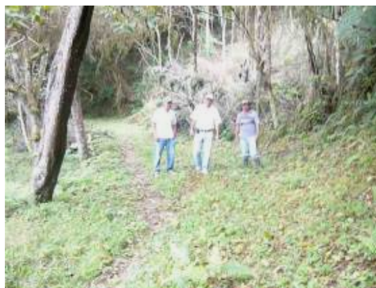
Servidumbre ubicada entre las áreas adquiridas del predio La Reina