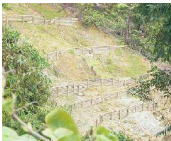
Predio La Tribuna, trabajos de recuperación de áreas degradadas, canalización y evacuación de aguas que afectaban el terreno y construcción de trinchos

-Convenio No.011 de 2007, celebrado con la Asociación para el desarrollo social integral - ECATE, por $10.000.000, con el objeto de aunar esfuerzos técnicos, económicos, físicos y humanos en la realización de acciones tendientes a la implementación de la propuesta de trabajo para la capacitación, sensibilización y organización en torno a la protección de los recursos naturales, en especial el recurso agua en cinco comunidades del municipio de San Pedro, con obligaciones como la sensibilización y capacitación a 200 niños y 60 líderes comunitarios representantes de las juntas de acción comunal, asociación de madres comunitarias y asociación de padres de familia en el cuidado, uso racional del recurso agua, entre otras.