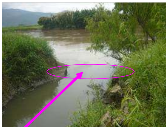
Punto de descarga al Rio Cauca, de las aguas residuales del municipio de Buga a través del Zanjón Tiacuante - Municipio de Buga